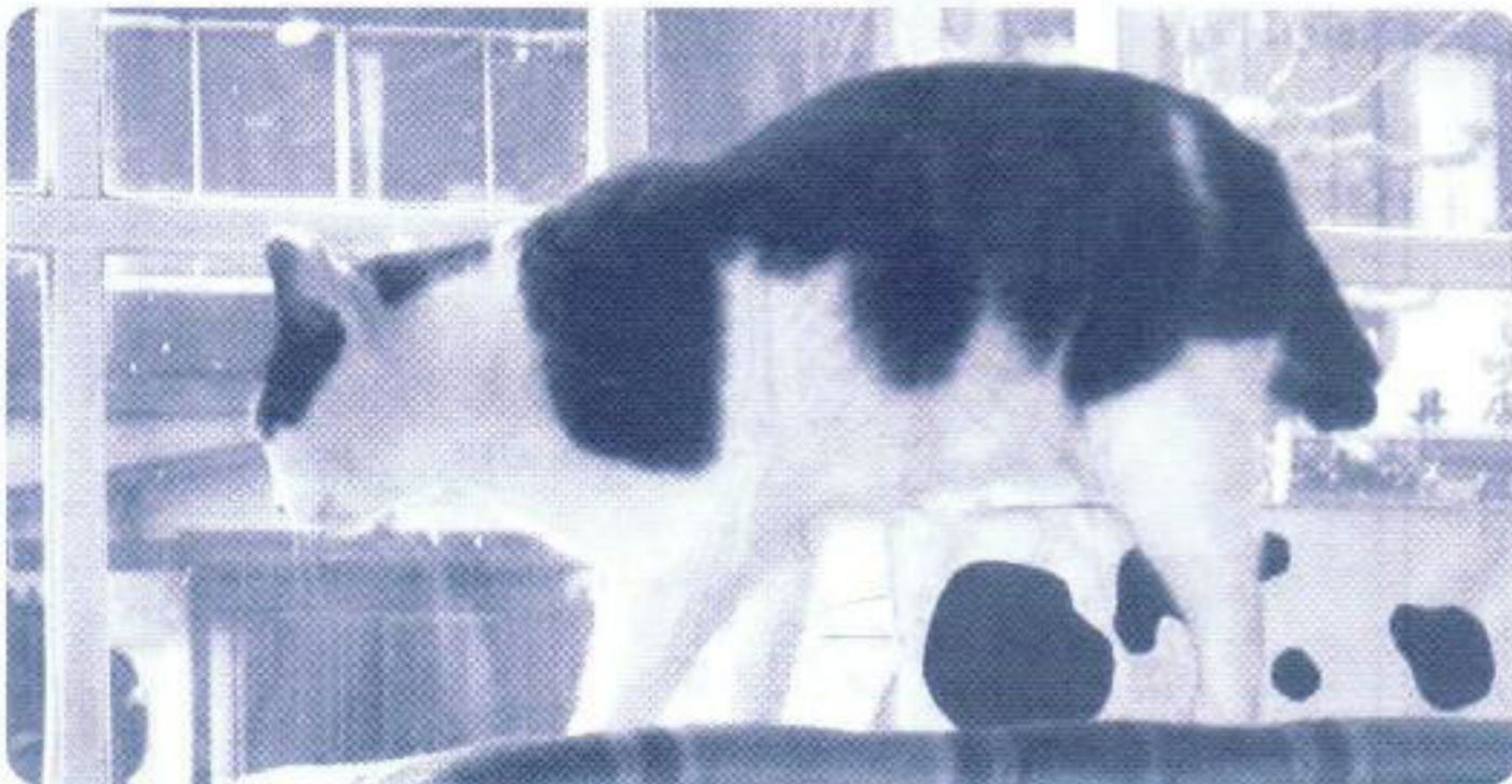
猫背だって？ アッシにゃ責任ニャ〜!!

椅子に腰かけるときは背もたれにもたれかからず、浅く腰かけて意識して背骨を伸ばすなど、ちょっとした心掛けでずいぶん改善されます。さらに身近かの人に常に点検注意してもらうことも有効です。姿勢制御のコツを覚え、アトピーを軽快させましょう。