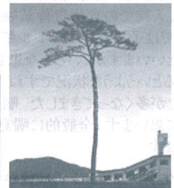
陸前高田市のHPより転用

http://www.city.rikuzentakata.iwate.jp/kategorie/fukkou/ipponmatu/tirashi-jp.pdf